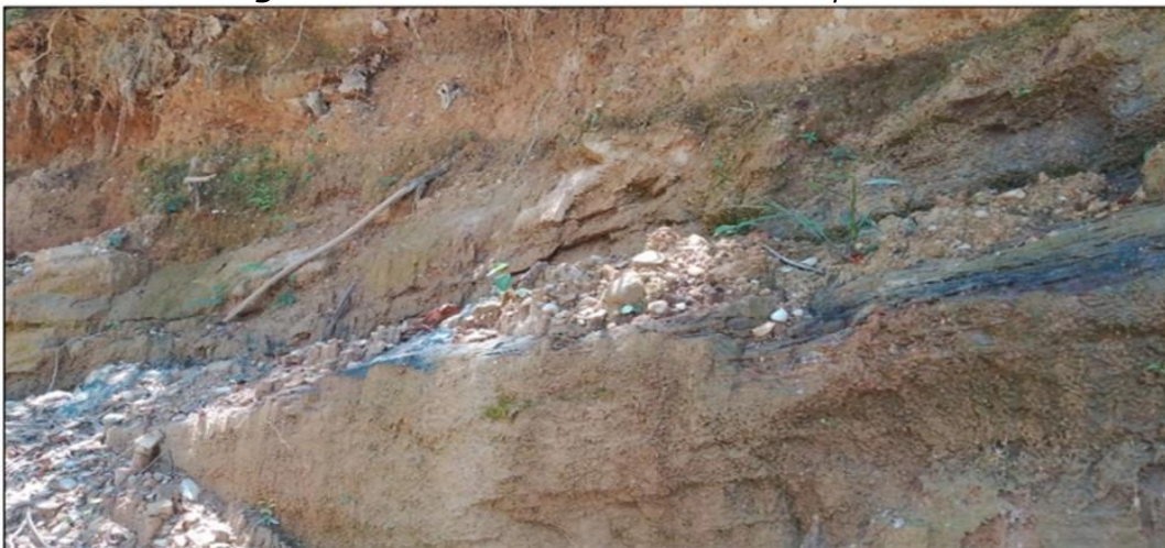
Fotografía No. 9. Panorámica Frente de explotación N°7.

No se implementa un método de explotación definido en el Frente de explotación N°7, realizaron en este Frente labores de cateo, las dimensiones aproximadas de la explotación son: largo de 15 metros y una altura de 3.5 metros; con rumbo en sus estratos de N25°W y un buzamiento de 12°; el Frente se encontró sin actividad recientemente, los solicitantes indican que el arranque del mineral siempre se ha realizado de manera manual utilizando herramientas como palas, picas y barras metálicas. El Frente de explotación N°7 ubicado en la coordenada Longitud: -75,16795 y Latitud: 1,93582, se encuentra ubicado dentro del área de la solicitud minera ARE-509242, y en el Frente se realiza explotaciones de material de ASFALTO NATURAL.