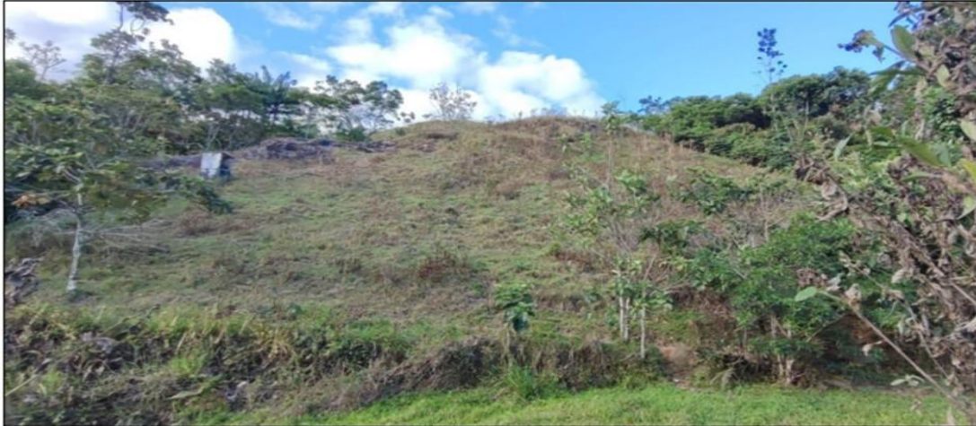
Fotografía No. 10. Panorámica Frente de explotación N°8

No se implementa un método de explotación definido en el Frente de explotación N°8, las dimensiones aproximadas de la explotación son: largo de 50 metros y ancho de 30 metros; el Frente se encontró sin actividad recientemente, los solicitantes indican que el arranque del mineral siempre se ha realizado de manera manual utilizando herramientas como palas, picas y barras metálicas. El Frente de explotación N°8 ubicado en la coordenada Longitud: -75,14820 y Latitud: 1,92740, se encuentra ubicado dentro del área de la solicitud minera ARE-509242, y en el Frente se realiza explotaciones de material de ASFALTO NATURAL.