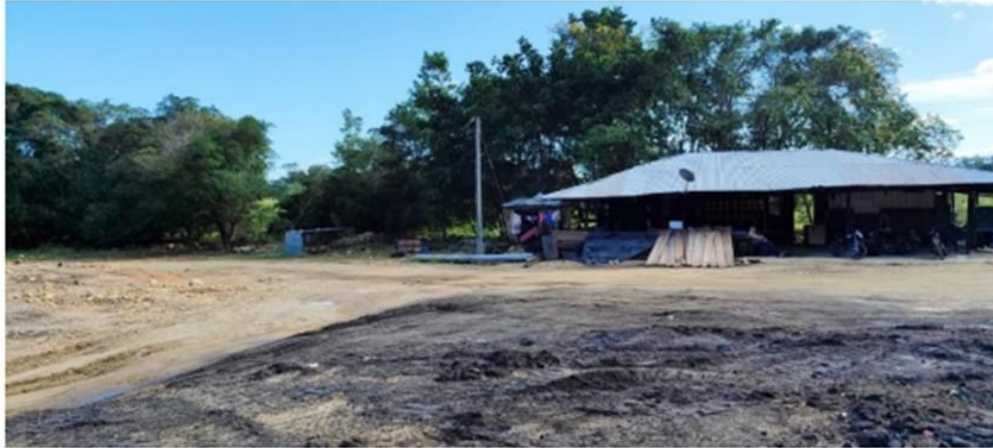
Fotografía No. 19. Campamento.

Por medio de la cual se declara y delimita el Área de Reserva Especial ARE-509242, presentada en el Sistema Integral de Gestión Minera Anna Minería bajo el radicado No. 94728-0 del 22 de abril de 2024, se imponen unas obligaciones y se toman otras determinaciones